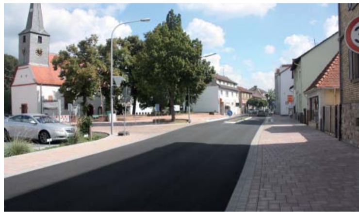
Die neu gestaltete Darmstädter Straße am Dalles.