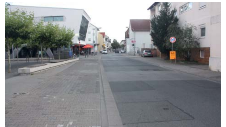
So wollen SPD und FWV die Darmstädter Straße am Medienschiff belassen.