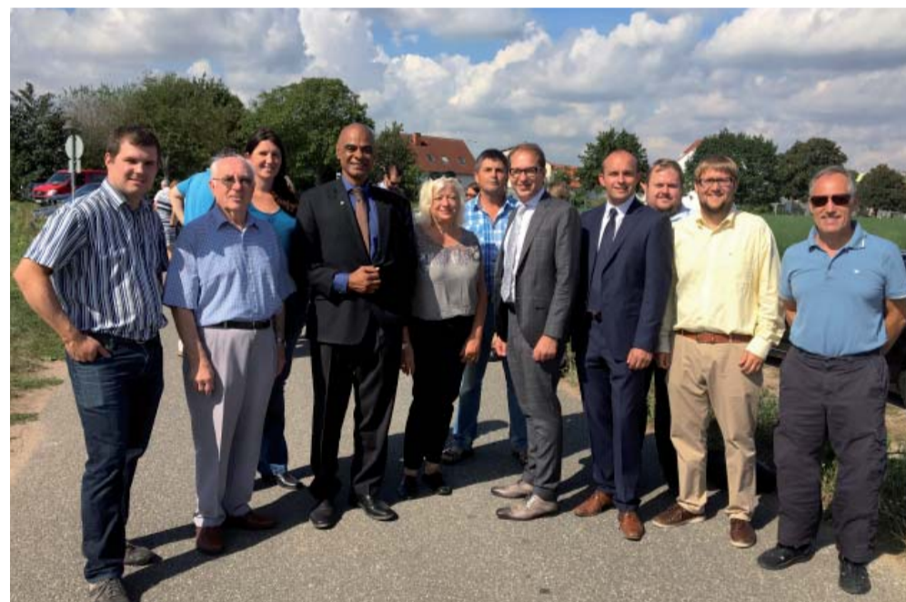
Delegation der CDU Weiterstadt mit Charles M. Huber MdB und Bundesminister Alexander Dobrindt MdB