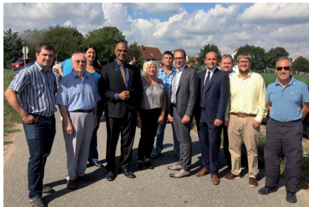
Delegation der CDU Weiterstadt mit Charles M. Huber MdB und Bundesminister Alexander Dobrindt MdB